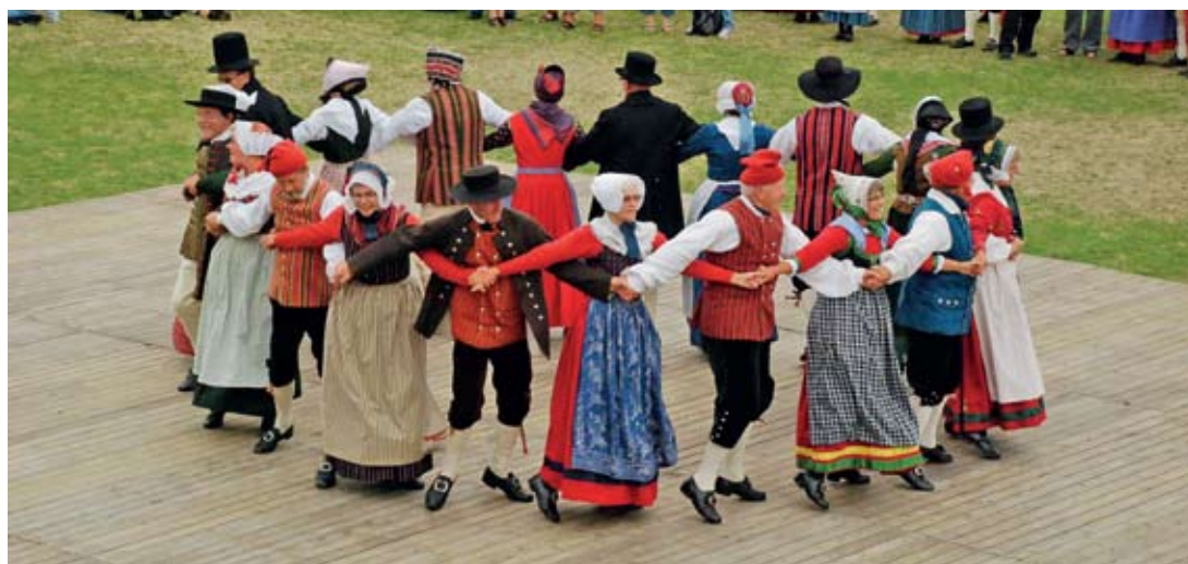
"Fynboerne" danser opvisning ved Landsstævnet i Nyborg.