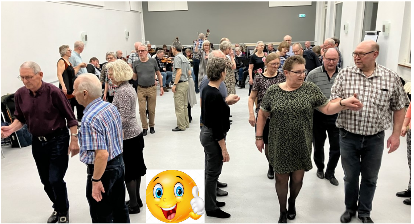
Hele 4 kvadriller mødte op til ballet efter Spillemandskredsens generalforsamling